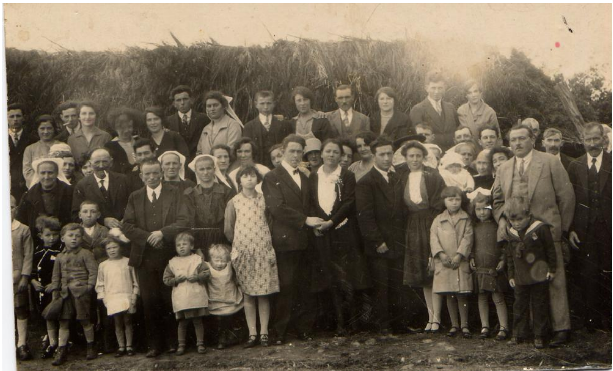
Cette photo coupée en deux parties ci-dessous pour quelques identifications

Voici donc notre photo du mariage du 5 octobre 1929 :