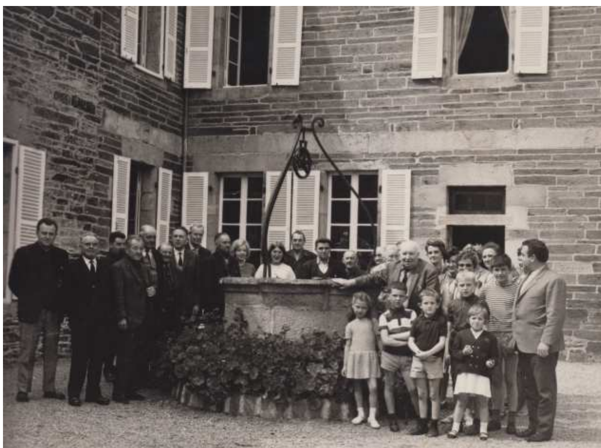
Collection Claude de Langle (que je remercie vivement)

La photo ci-dessous garde le souvenir de cette réception.