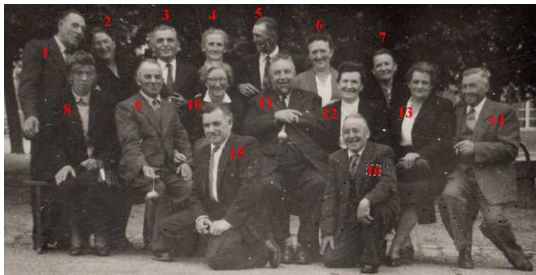
Vous trouverez la photo sans mes numéros plus bas.

Essayons de les identifier et d'en dire un peu plus de chacun d'eux. Vous m'aidez pour les six cinquanténaires auxquels je n'ai pas attribué de nom de peur de me tromper. Vous trouverez plus bas la liste des enfants nés en 1905 à Guerlesquin, avec quelques indications. Après vos apports, je modifierai cette page du blog. Merci.