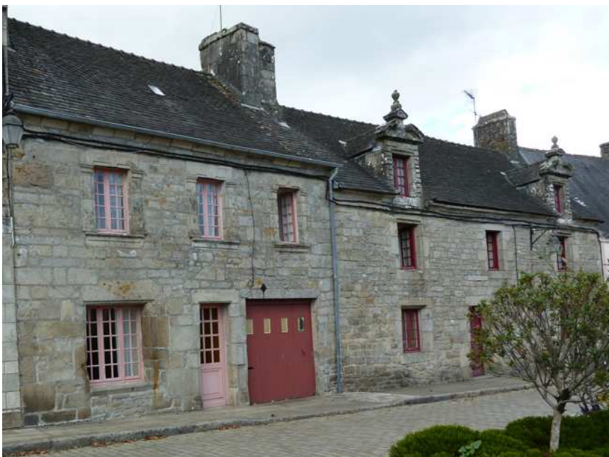
Maison du Bris à gauche, maison du Cosquer à droite

Oh, cette maison n'est pas très loin de la maison du Cosquer . C'est la maison qui lui est contiguë du côté du couchant , autrement dit du côté Ouest.