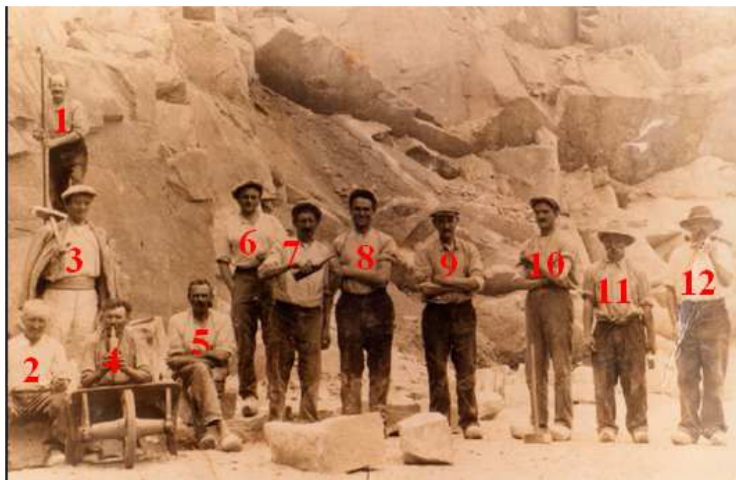
La même photo sans mes numéros à la fin de l'article.

Pour tout révéler, mais que ça reste entre nous hein, on a cessé d'extraire du granit là avant au moins la guerre 39-45, peut-être plus tôt. Et, donc c'est entre nous, pendant des années le trou béant laissé a été une décharge à ordures. Je suis convaincu bien sûr qu'on a fait ce qu'il fallait quand on a bouché ce grand trou. Mais j'ai pensé pendant longtemps que dépotoir se traduisait en breton par vingleu .