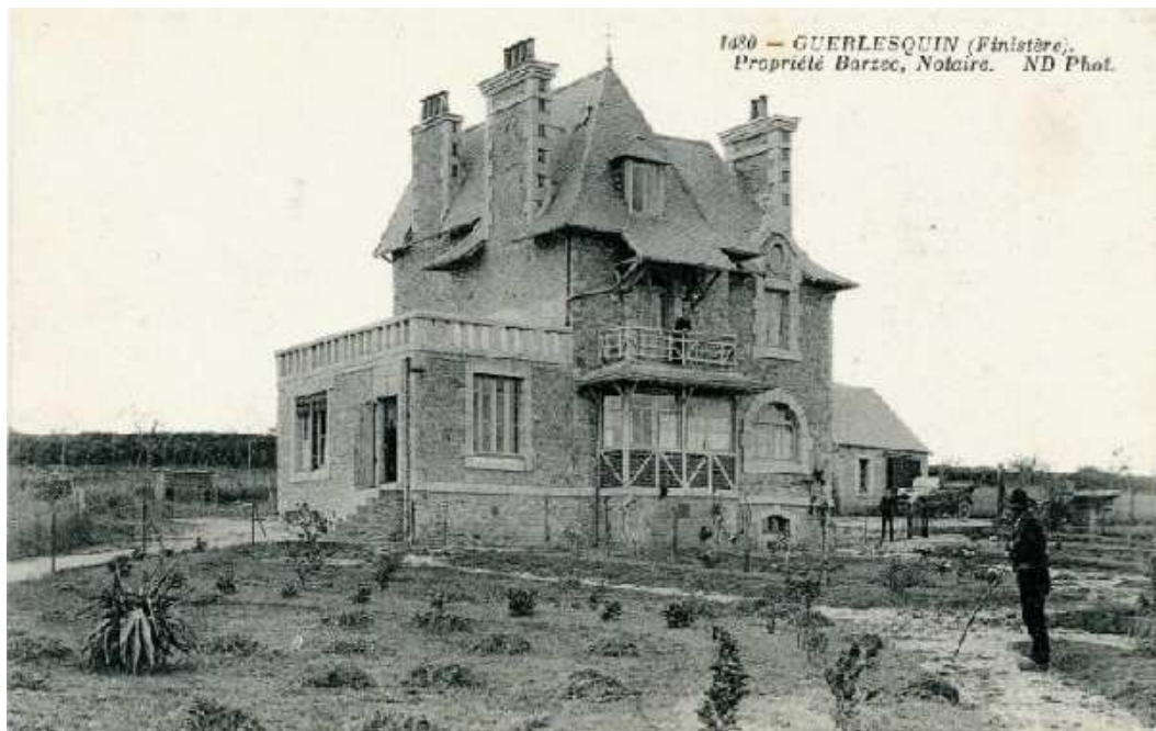
La propriété Le Barzic, indiquée par erreur Barzic sur cette carte postale