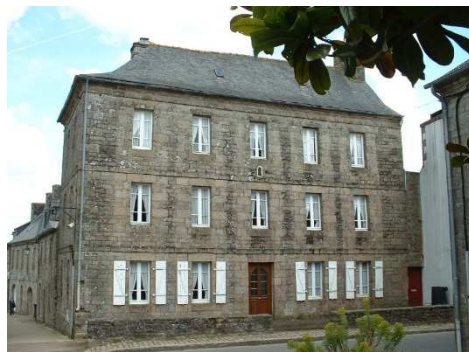
La grande maison de Pors Cadiou