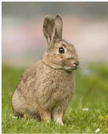
Lapin de garenne Image Wikipédia 190

Alors, chez ma grand-mère à Plouégat-Moysan, y a des lapins dans le clapier, même couleur, même forme et tout et tout que les lapins de garenne. Quelquefois je les sors dans le jardin. Ils bouffent les pissenlits. Il y a aussi des poules. Elles, elles sont pas du tout sauvages puisqu'elles viennent quand je leur fais « pit' pit' ». Eh bien, un jour, quand ils sont assez gros, les uns ou les autres, poules et lapins, je les tue et on les bouffe. C'est pas interdit pour l'instant, même si ça fait pas plaisir aux végans et véganes.